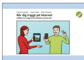
Bok: Rör dig tryggt på internet

När den unga fyller 20 år upphör rehabiliteringspenningen för unga.