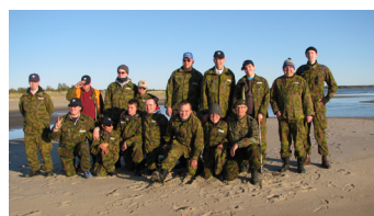
Läger: Lär känna militärlivet

Med hjälp av boken lär du dig använda internet på ett tryggt sätt. Boken berättar om hur man ska bete sig på internet och vad man ska vara försiktig med. Man lär sig om både fördelar och risker på internet, till exempel i sociala medier, e-post, internetbanker och internetbutiker. Man lär sig också om upphovsrätt, virus och vad som är olagligt på internet.