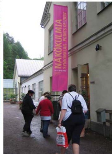
12. Andra lägret gjorde en utfärd till Fiskars. Här på väg till utställningen i Koppar-medjan.