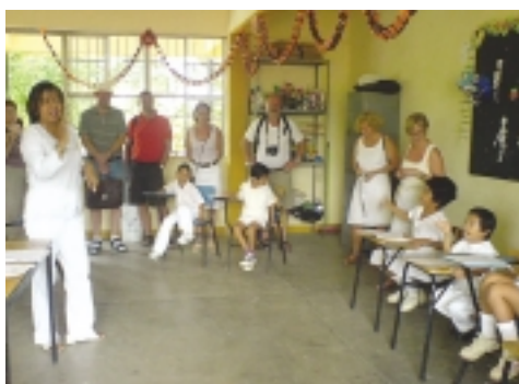
Den nordiska gruppen på besök i en av stadens specialskolor i Acapulco.

De båda pedagogerna berättade att de skulle ha hur mycket jobb som helst eftersom man under de senaste åren förändrat sin syn på handikappade och att man också i staden Acapulcos undervisningspolitiska program uttalat en önskan