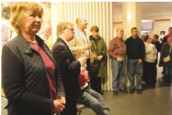
Församlingen lyssnar ...