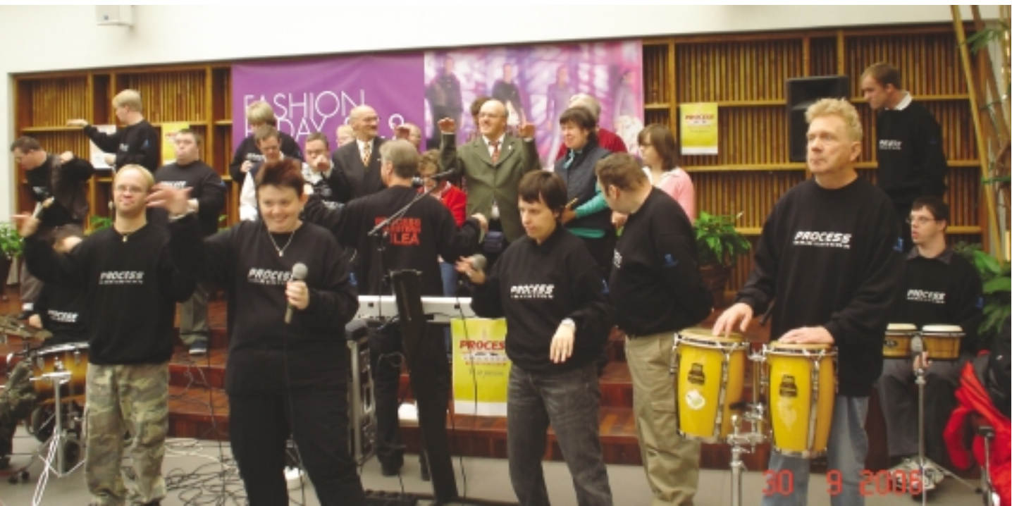
LaBandet och Process uppträdde tillsammans i köpcentret Rewell Center.