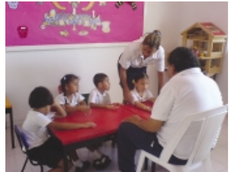
Elever i blindskolan.