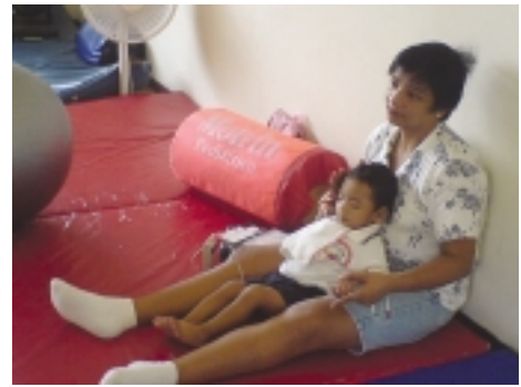
En mor med sitt barn på rådgivningen i Acapulcos slumkvarter.