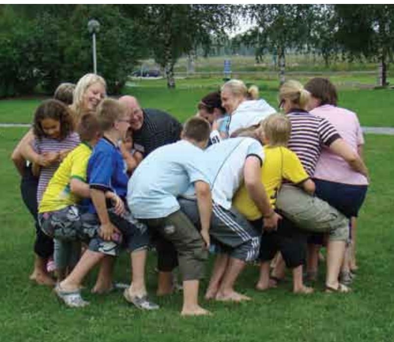
Samarbetsövning där vi står i ring och ska sätta oss i famnen på den som står bakom.