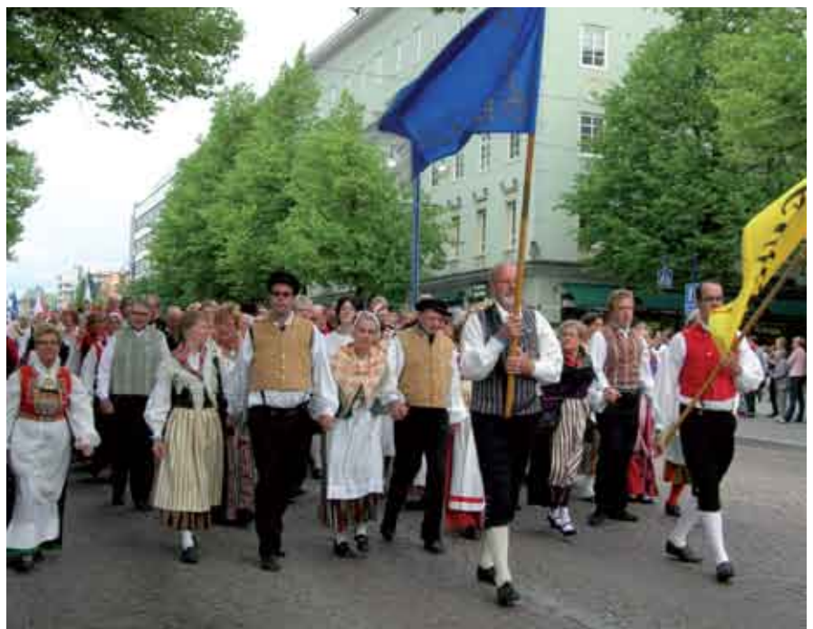
Festtåg genom stan

VI KAN-dansarna Stampa Lagom från Pargas, Kimitoskuttarna, Hopp och Skutt från Borgå, Hjortarna från Åland och Riemukkaat från Tammerfors deltog med lust och glädje. Från Sverige deltog dessutom VI KAN-grupperna Rekarne, Stureforsgillet och