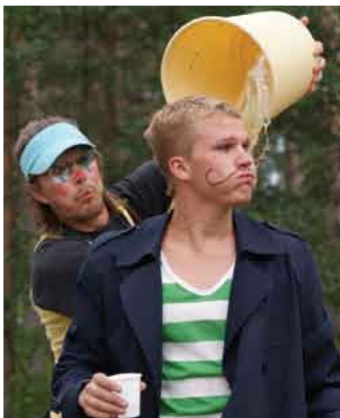
Cirkusdirektörn blir offer för clownens hyss ..