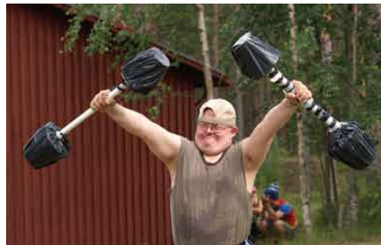
Stigu som "starke mannen" på cirkusen.