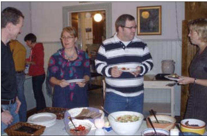
Att få träffa andra föräldrar var det bästa.