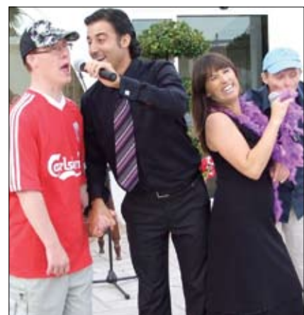
Duo Intermezzo underhåller.

Solgård eller på spanska Hacienda del Sol har anor tillbaka till år