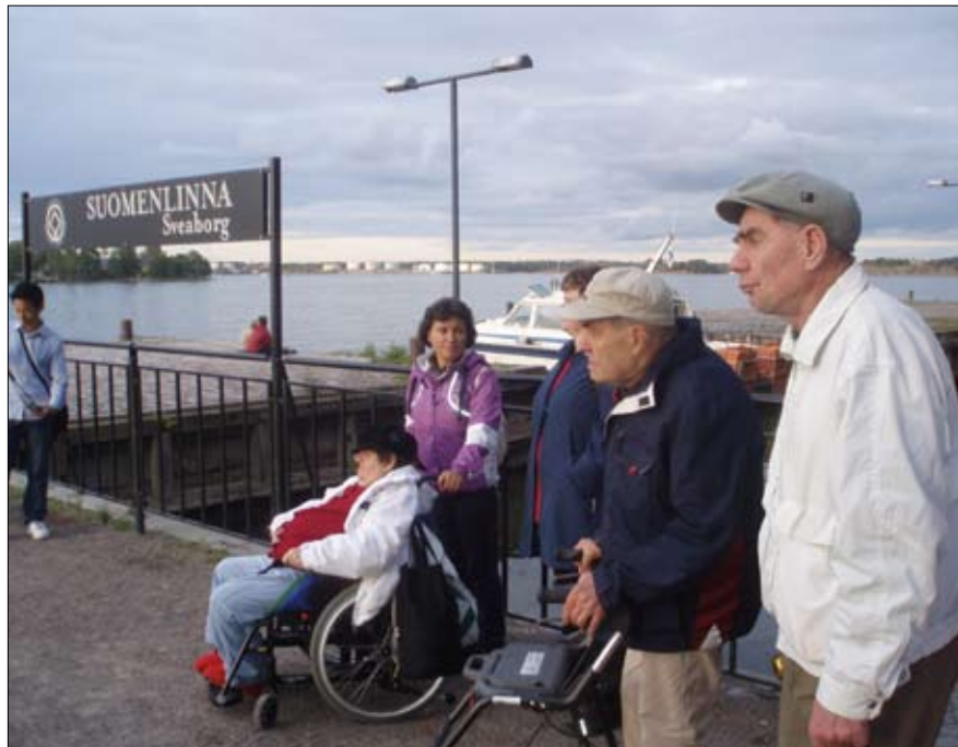
Efter mycket promenerande återvände vi med färjan till fastlandet.