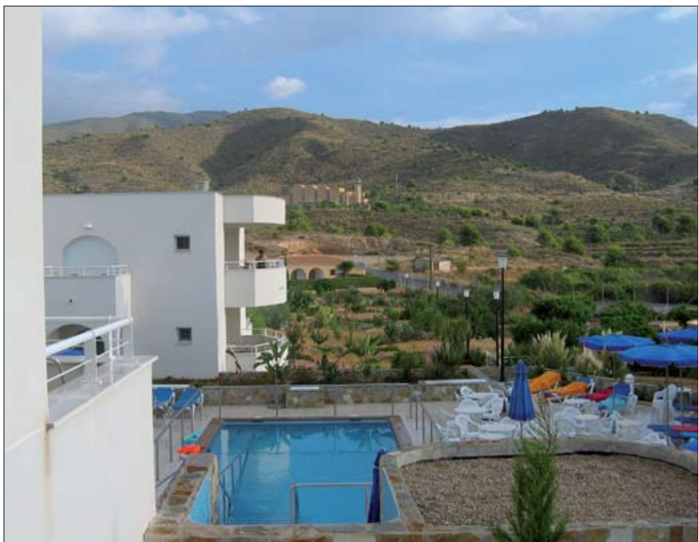
En av hotellets bassänger med utsikt över berget Puig Campana.

Vi kan säga att denna resa var en ögonöppnare för hur norrmän försäkrat sig om att personer med utvecklingsstörning med stort behov av assistans också får en plats i solen. I dag ordnas fem resor per år till Solgård från olika platser i Norge. Personerna som reser ner blir redan på flygplatsen mottagna av Solgårdens personal och får