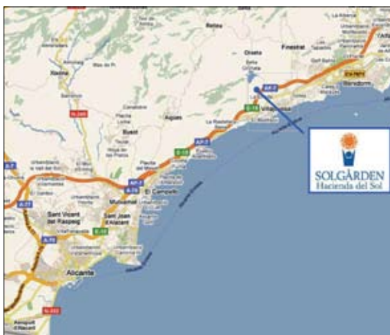
Redo för sightseing.

resa i ett eget chartrat plan. Ett nära samarbete mellan Solgård och SAS har gjort att besättningen ombord är skickliga på bemötande och att alla passagerare känner sig trygga och säkra på flygresan.