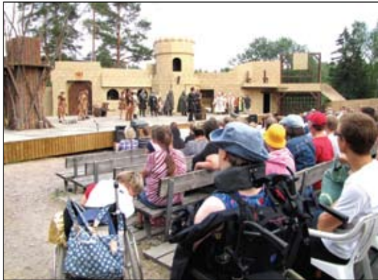
På Raseborgs sommartheater.