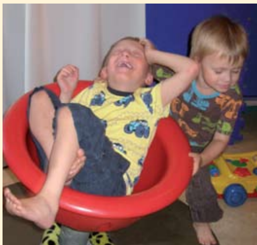
Barnen fick kasta loss på Bamsefamiljernas ommarträff.

När vi under månadsträffarna och på diskussionsforumet på internet talar om våra barn och beskriver dem och deras funktionshinder kan det vara svårt att skapa en riktig bild av dem. Våra familjeträffar ger en helt annan