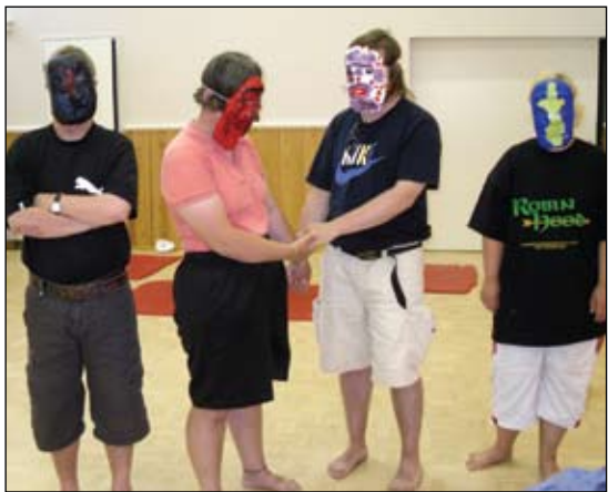
Maskerna användes på dramapassen.