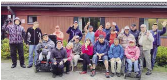
Läger på Koupo i maj 2017.

Familjesimning startar 2.9 (6 gånger under hösten)