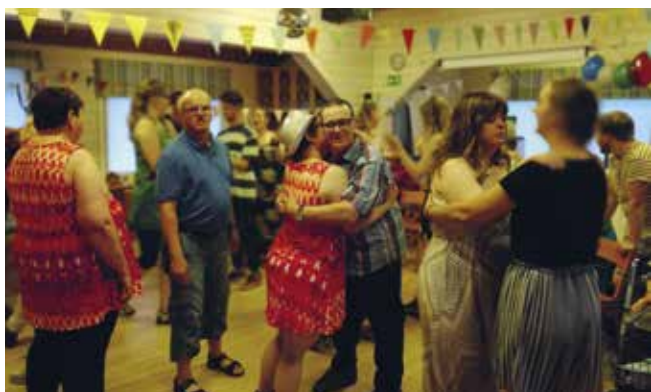
Disko på Villa Elba.