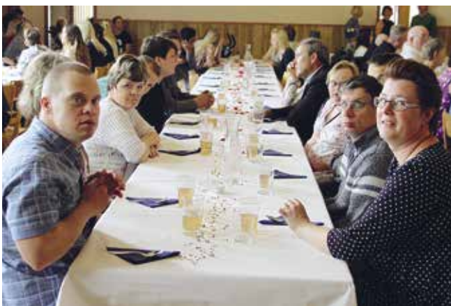
DUV i Jakobstadsnejdens jubileumsfest lördagen den 5 augusti.

Simningen vid Östanlid startar igen 16.9 kl. 13.15–14. Fotbollslaget Jaro Rocket försätter träningarna som förr. Vid intresse kolla vår egen webbplats.