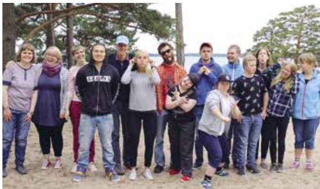
Ungdomslägret på beachen.